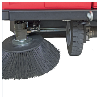
Derde zijborstel Troisième brosse latérale