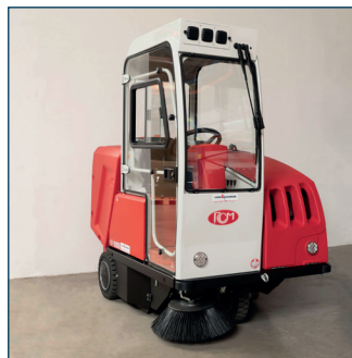
Afdak en cabine Toit et cabine