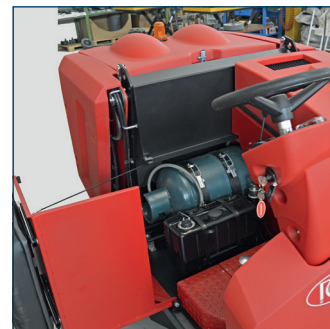
LPG systeem Version GPL