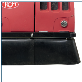
Stofgeleider Bavette caoutchouc